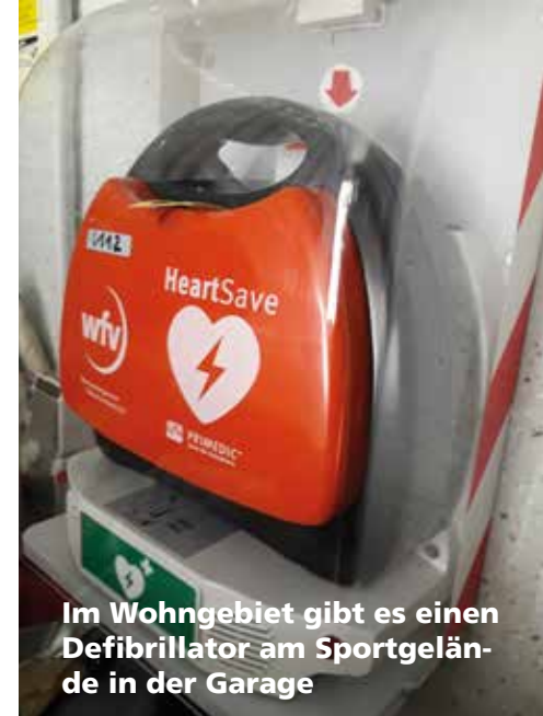
Im Wohngebiet gibt es einen Defibrillator am Sportgelände in der Garage

In der vergangenen Jahren wird immer häufiger über den Klimawandel und Umweltschutz diskutiert, da es ist schon klar, dass unsere Umwelt in den letzten Jahren viel unter menschlichen Aktivitäten gelitten hat. Das Thema ist auch mit den Kindern von der Kindertagstätte Junges Gemüse (Element-I) aufgegriffen worden. Es kam von vielen Kindern die Beschwerde, dass auf dem Weg in die Kita so viel Müll rumliegt. Daraus ergab sich die Frage „was