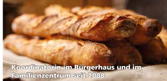
Koordinatorin im Bürgerhaus und im Familienzentrum seit 2008